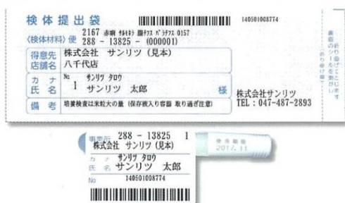
検体提出用袋と容器に貼るラベル