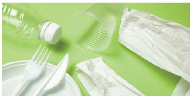
プラスチック・ゴム